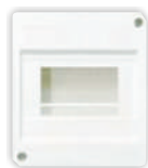
E115/4D 4 polos