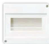
E115/6D 6 polos