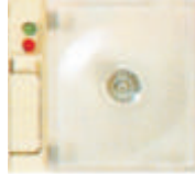
5495N Repuesto para 5495NB