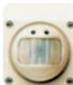
23972N de sobreponer