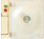
5495NB Lámpara de emergencia