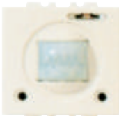
5378 de empotrar